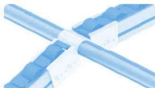
Variable Halter AL D28 Variable Holding Bracket AL D28